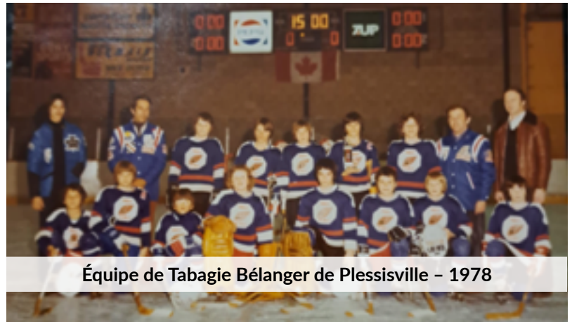
Équipe de Tabagie Bélanger de Plessisville – 1978

Le Tournoi provincial pee-wee a tenu sa première édition en février 1978!