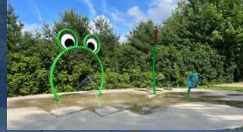
Parc du Domaine Somerset Accessible par la rue Chabot