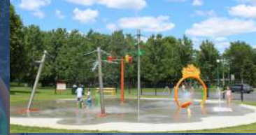
Carrefour de L'Érable (parc de la Rivière-Bourbon) 1280, avenue Trudelle