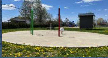
Parc des petits Braves 1720, rue Garneau

Ils sont ouverts tous les jours de juin jusqu'en septembre.